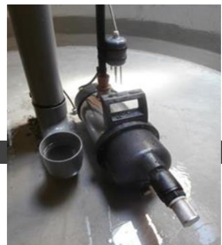
Utilisation dans une cuve en béton de 10000 L pour la récupération d'eau de pluie

Internet : http://www.aqua-dhome.fr - E.mail : info@aqua-dhome.com